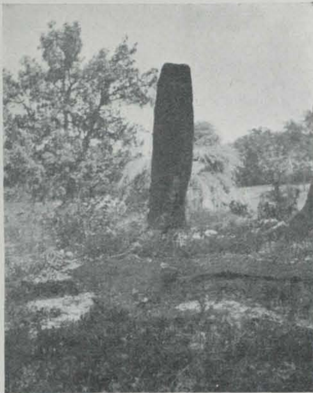
Fig. 1. (Fot. J. Sabater.)

5. PEDRES DRETES D'EN LLOVERAS. — Al mig del bosch, prop del camí que puja de Sta. Cristina d'Aro a Mobet, hi han les pedres així anomenades, que sens dubte haurien